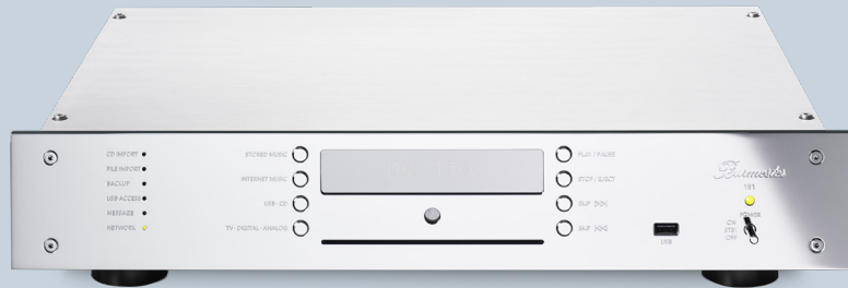
151 MK2 TOP LINE