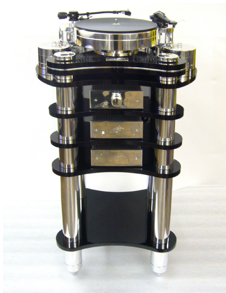
Ausgestattet mit Laufwerkstisch, zwei Tonarmen, TMD Lager mit zwei Motoren, Aufstellbasis, Vorverstärker PHONO 8 MC sym. mit separatem Elko-Speichernetzteil und Konstant M-2 Reference