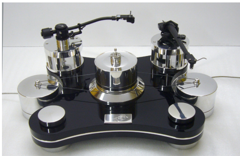
Ausgestattet mit zwei Tonarmen und TMD-Lager mit zwei Motoren (Ansicht ohne Plattenteller)