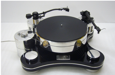
Ausgestattet mit zwei Tonarmen